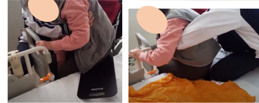
身体機能評価・福祉用具選定 介護職員が実践できる方法を評価